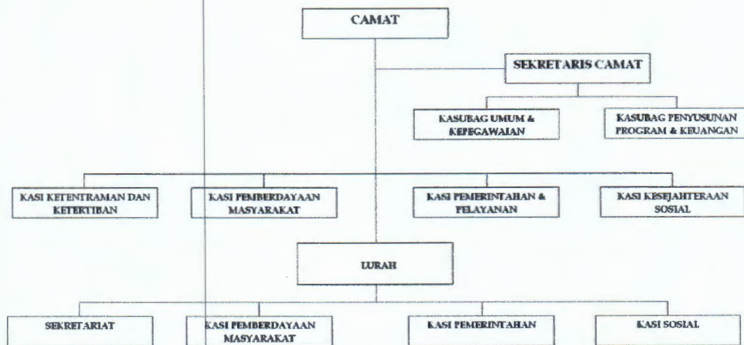
Gambar 2.2 Struktur Organisasi Kecamatan Purwosari

Adapun Tugas pokok dan fungsi Kecamatan Purwosari Kabupaten Pasuruan yang akan dipakai landasan penyusunan program dengan mengantisipasi perubahan dan perkembangan dimasa yang akan datang adalah sebagai berikut: