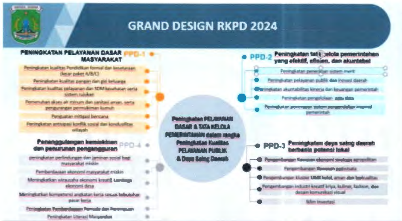
Gambar 1.1 Grand Design Rancangan RKPD Tahun 2024

kriya, kuliner, fashion dan desain komunikasi visual, iklim investasi yang kondusif, pengembangan kawasan industry wilayah timur.