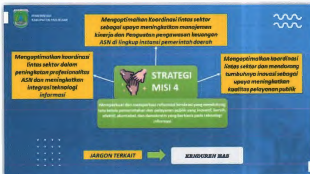
Gambar 2.1 Integrasi Jargon dan Strategi pada Misi 4

Berdasarkan Perubahan RPJMD Kabupaten Pasuruan Tahun 2018-2023, Bappeda mendukung pencapaian misi ke-4 daerah, yaitu “memperkuat dan memperluas pemerintahan dan pelayanan public yang inovatif, bersih, efektif, akuntabel dan demokratis yang berbasis pada teknologi informasi” perluas reformasi birokrasi yang mendukung tata kelola” dengan tujuan “Mewujudkan Kinerja Pemerintah Daerah yang Profesional, Transparan, Akuntabel dan Responsif . Dalam rangka mendukung pencapaian visi dan misi Kepala Daerah, integrasi antara jargon dengan strategi terintegrasi berikut ini