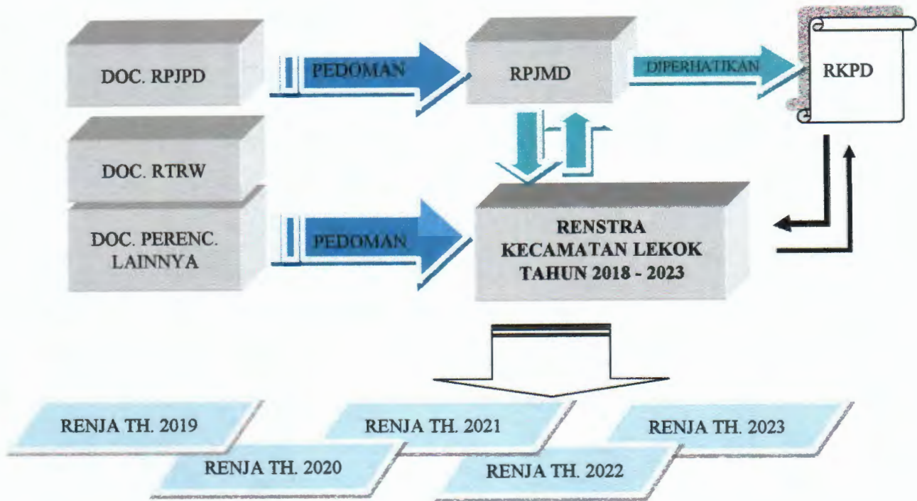
Gambar 1.1 Keterkaitan Antar Dokumen Perencanaan